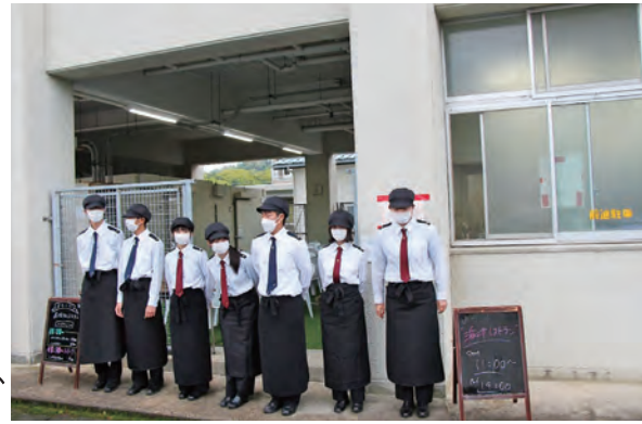
2年生も接客・調理に参加しました。

地域活性化に繋がられるように、毎月開催する予定です。皆様の御来場を心よりお待ちしております。