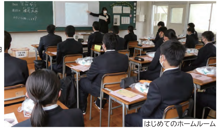
はじめてのホームルーム

56の中学校から本校に入学され、新しい生活をスタートさせた新入生には、授業・実習、部活動、ボランティア活動等、海洋高校ならではの充実した学校生活を通して、大きく成長していただきたいと思います。