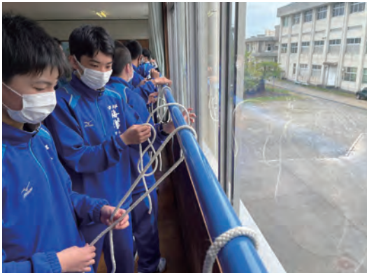
1年生の初実習はロープワークです。