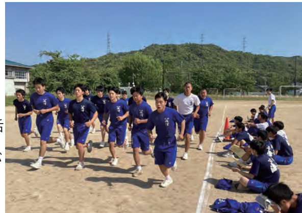
記録係の声掛けで最後の力を振り絞ります。

最初は完走するだけで精一杯であった1年生も、体育の授業や部活動、実習等を通して身体も精神的にもたくましく成長し、年次が上がるごとに周回数が増え、体力の向上を実感するようです。「毎回、自分のベストを目指す」を目標に、がんばっています。