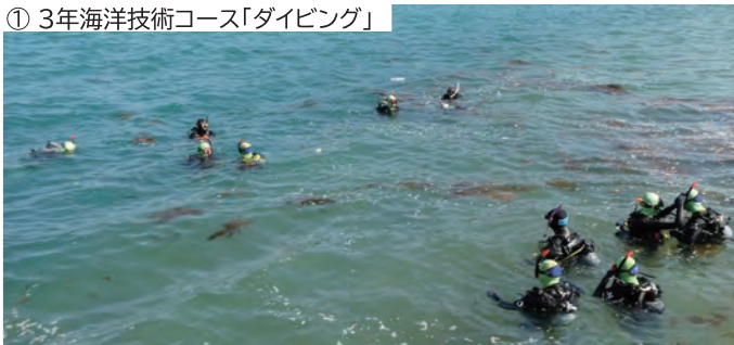
① 3年海洋技術コース「ダイビング」

本校の敷地に隣接した棧橋(防波堤を兼ねる)は、実習船の係留以外にも、素晴らしい実習フィールドとしての役割があります。