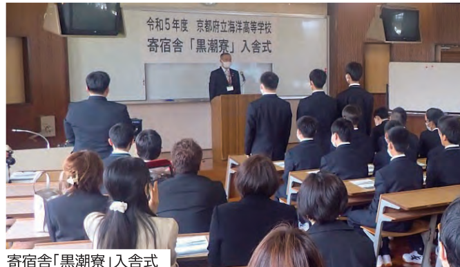
寄宿舎「黒潮寮」入舎式