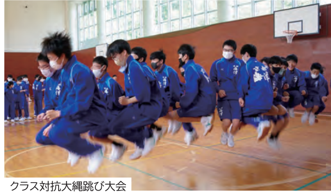
クラス対抗大縄跳び大会