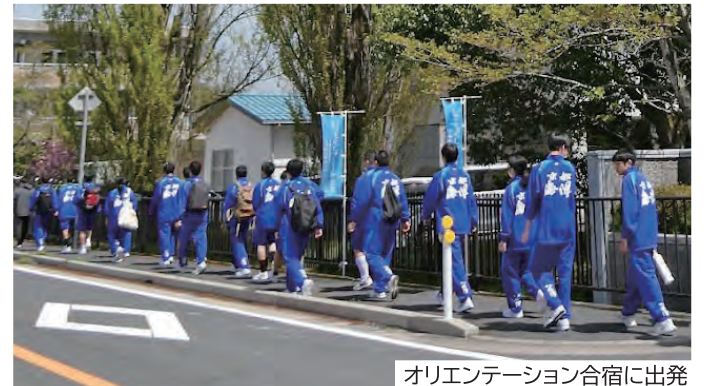
オリエンテーション合宿に出発