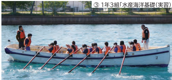
③ 1年3組「水産海洋基礎(実習)」