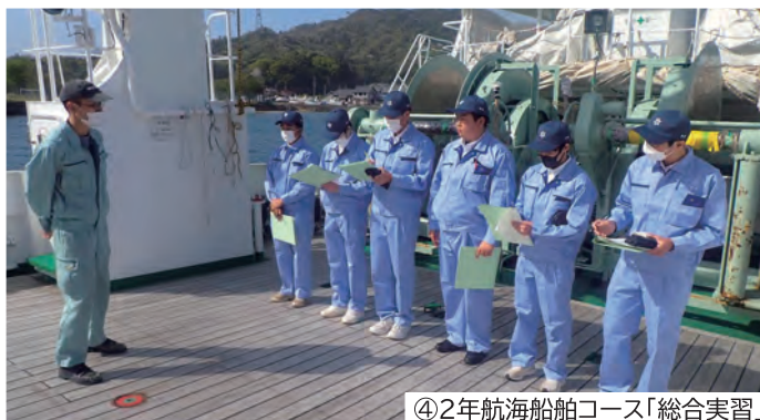
④ 2年航海船舶コース「総合実習」