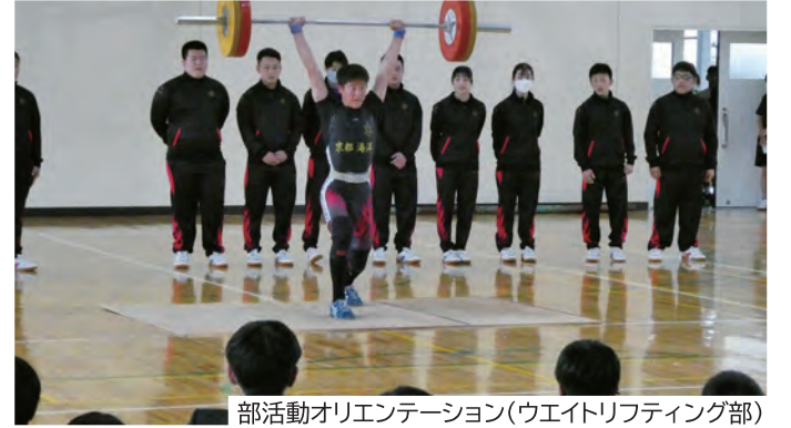
部活動オリエンテーション(ウエイトリフティング部)