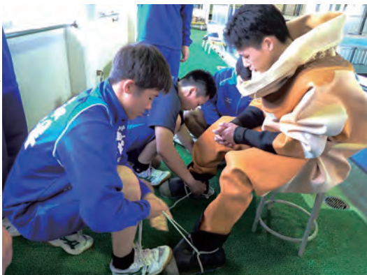
左(青色)がテンドー、右(橙色)が潜水士