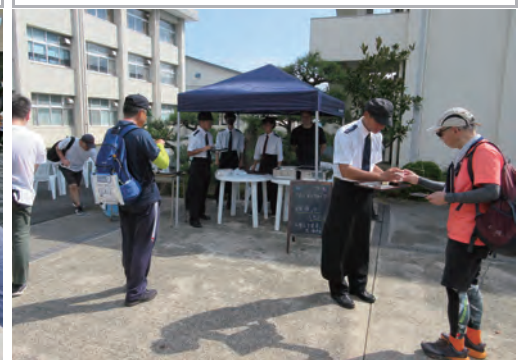
10月 天橋立ツブデーウオーク