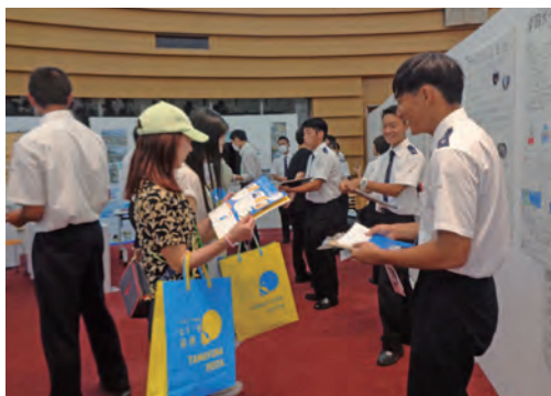
9月 たまゆらフェスタ