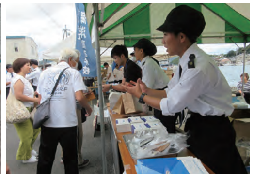
9月 まいづる魚まつり