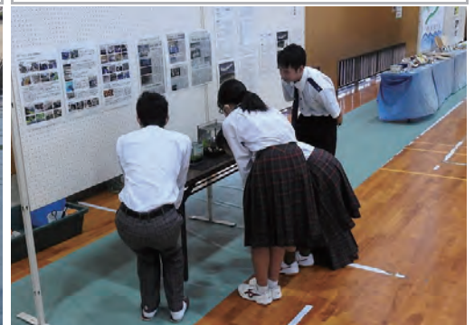
9・10月 丹後文化祭典