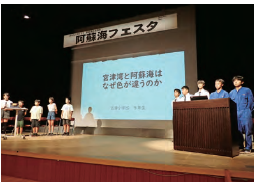
7月 阿蘇海フェスタ