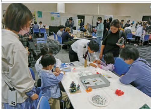
10月 里山里海つながるフェス