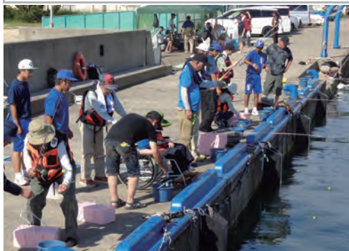
9月 障害者海釣り教室

令和5年度 頑張りました！ 多くのボランティア活動や イベントに参加しました。 令和6年度も 頑張ります！ ぜひ、お立ち寄りください。