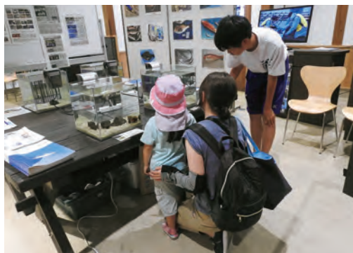
8月 丹後王国サマーフェスタ