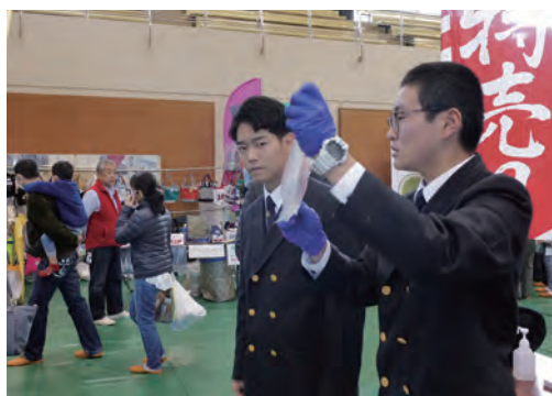
11月 みやづ産業フェスタ