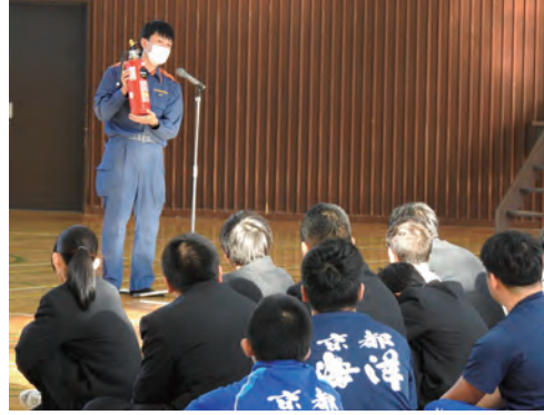
1年生 消火器の使用