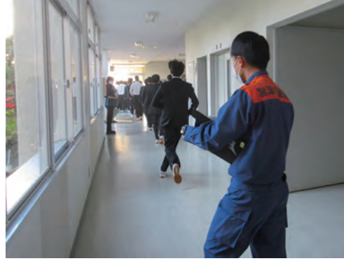
急いで、落ち着いて、避難