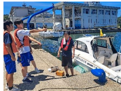
資格・検定講習(左 小型船舶、右 小型移動式クレーン)