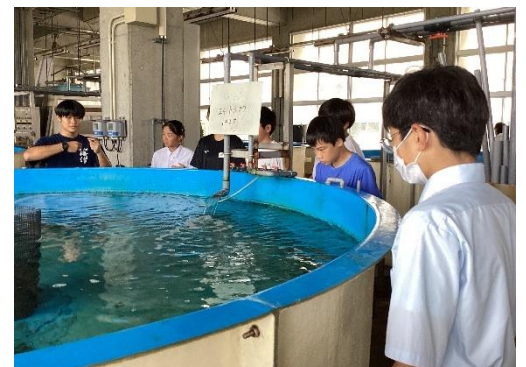
陸上養殖施設見学