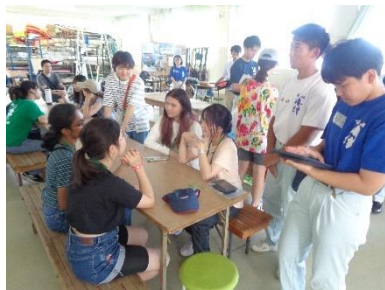
地球環境ユースサミット