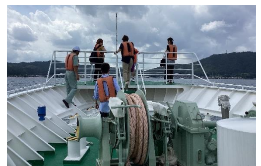
実習船「みずなぎ」体験乗船