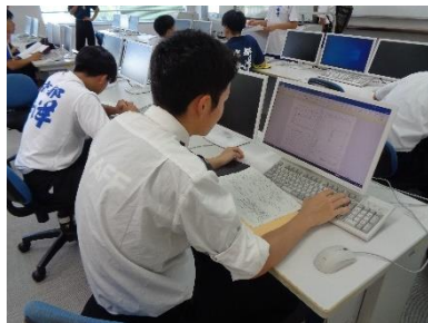
就職希望者 履歴書作成