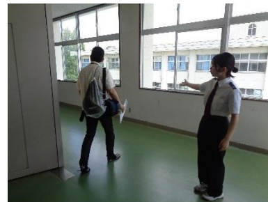
学校説明会運営補助