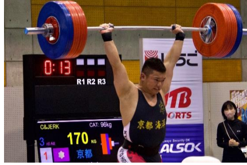
ウエイトリフティング部