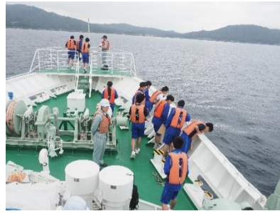
実習船「みずなぎ」乗船実習

実習船乗組員のきびきびとした動きで大きな実習船が動いていることがよくわかりました。